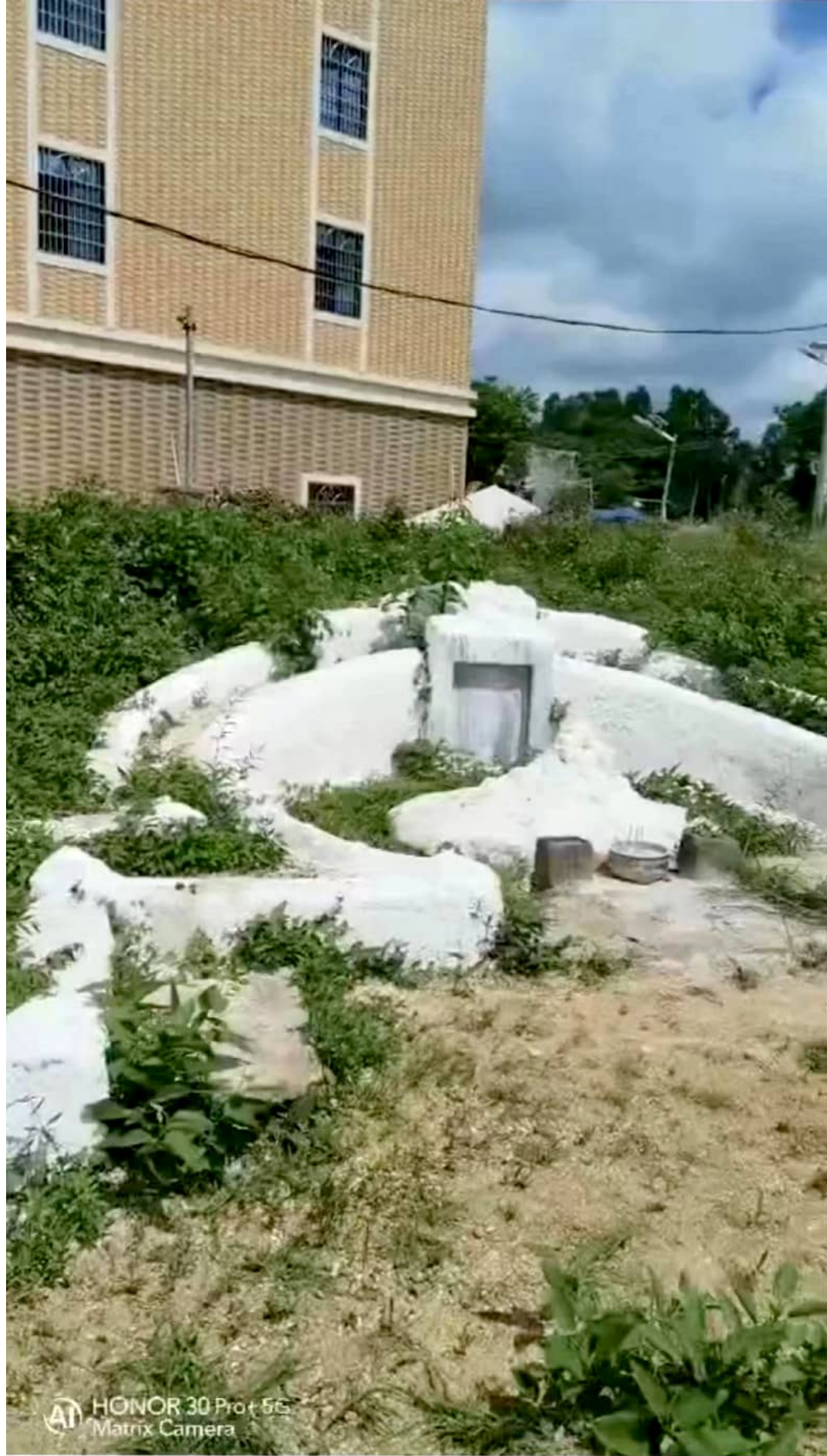
第二座古墓，距今679年历史。